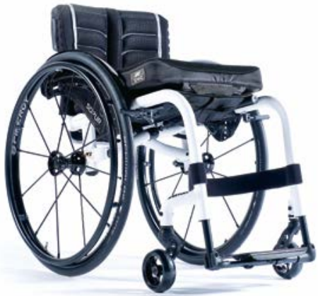
XENON ® FF DER LEICHTESTE