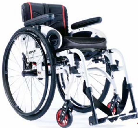
XENON ® SA DER ALLROUNDER