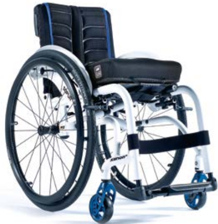
XENON ® HYBRID DER STÄRKSTE